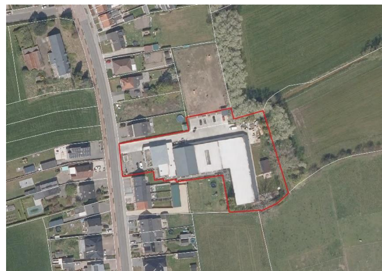
Figuur 2: Afbakening van het plangebied op orthofoto