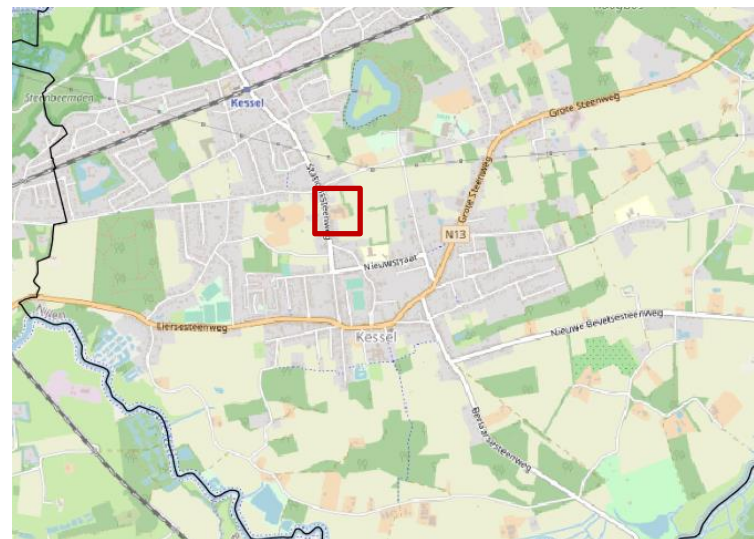
Figuur 1: Situering van het plangebied op een stratenplan

Het plangebied heeft een oppervlakte van ca. 6133m 2 .