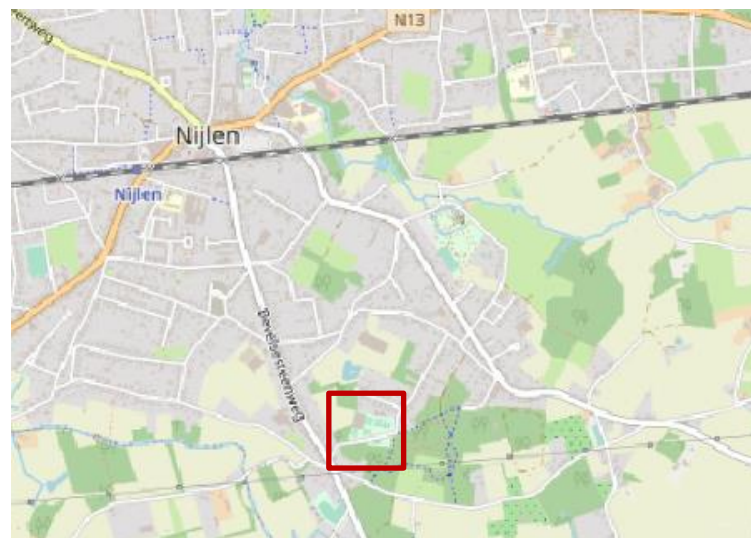
Figuur 1: Situering van het plangebied op een stratenplan

Tot slot is er één perceel in het plangebied dat ten zuiden van de weg Molenbos ligt, dit is perceel C800b. C800b bevat het basketbalveld, de petanquebanen en een onverharde parking, allen parallel gelegen aan de rijweg. De rest van het perceel is bebost met naaldbomen. Het beboste deel maakt geen deel uit van het plangebied.